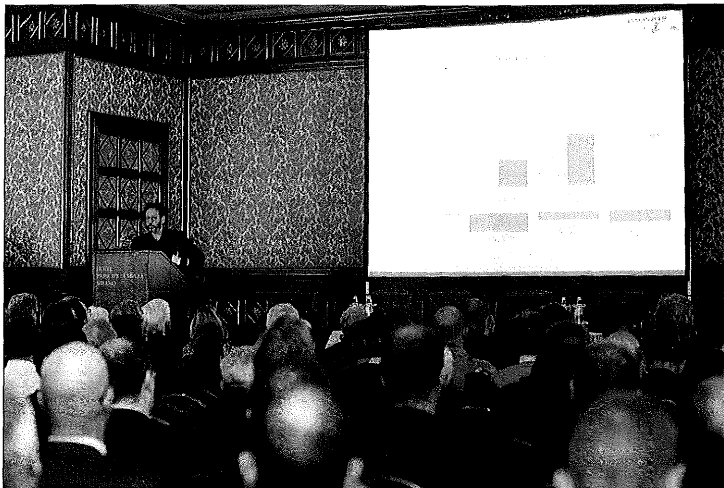
20 anni di Finco, il convegno